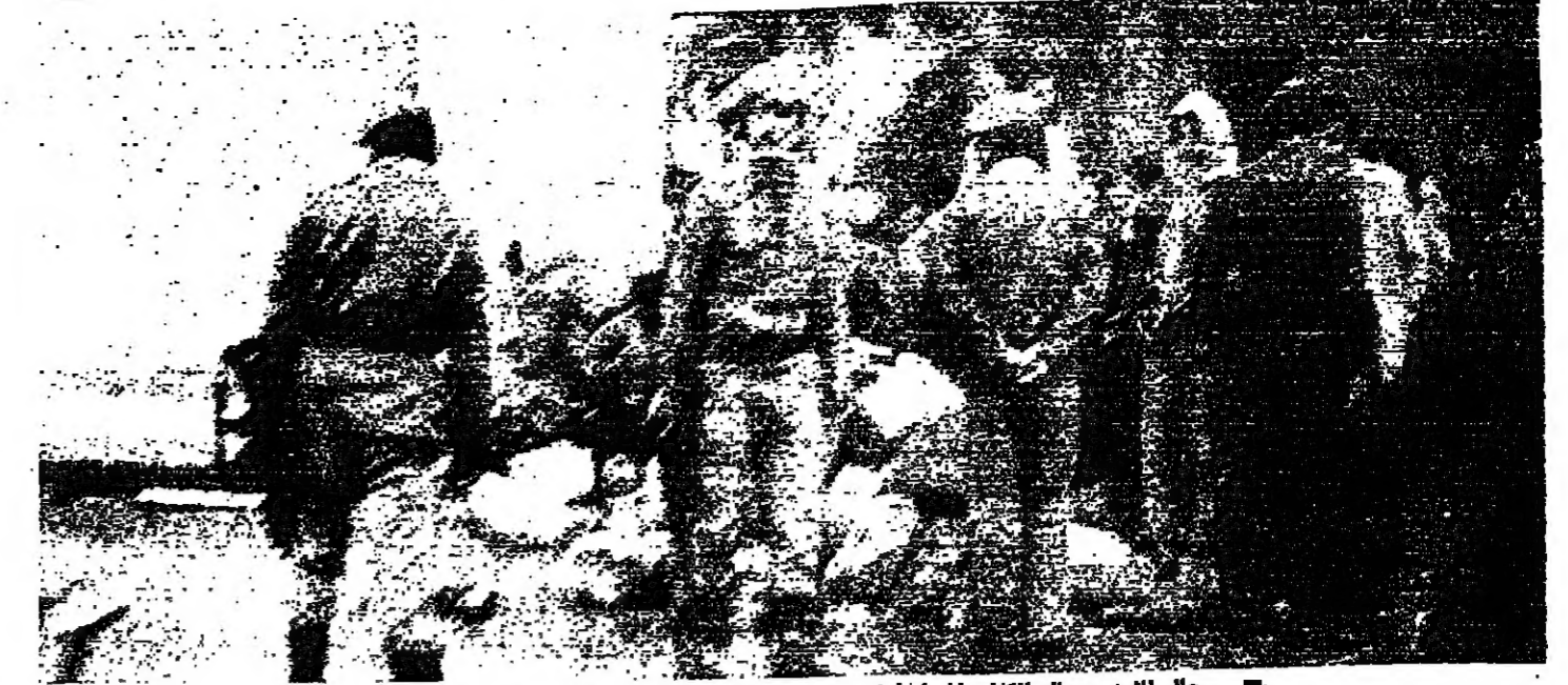
رجال الامن والحواجز المسلحة امام المراسم الرئيسية في القبة قبل ازالته

الطرابلس في القبة . الحوجز تم توجه وفد الاجتماع المشترك الى منطقة القبة ، وطلب من المسلحين رفع حواجزهم نهائيا والتوقف عن اطلاق النار ، فاستجابوا للطلب فوراً وانحروا الطريق . ومن القبة انطلقت البات قسوى الامن باتجاه مجددا ، حيث استجاب المسلحون المتمركون هناك الى طلب الانسحاب . وكانت طرابلس قد عاشت ليلتا متعرجا امس ، نزلت خلاله محلات نبيه قرب السراي القديم ، وبطعم سرور في ساحة الصنبي ، ومقهى شلاب في ساحة الشهداء ، ومقهى